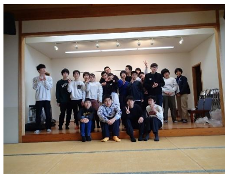
校外学習 このメンバーで最後の集合写真