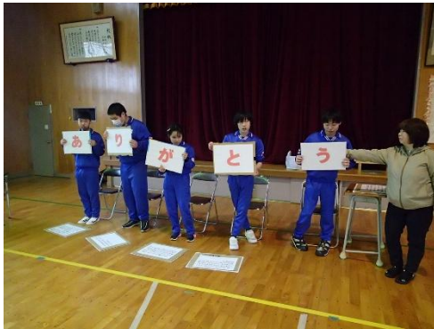
3年生からのメッセージ

2月25日に「卒業を祝う会」を実施しました。在校生が、3年生が喜んでくれる会になるよう準備を進めてきました。スライドショーでは、スケッチブックリレーで在校生一人一人から3年生へメッセージを送りました。3年生からも自分が頑張ったことの発表や感謝のメッセージがありました。最後に、事前学習で作成した、トキの共同制作をバックに記念撮影をしました。3年生の卒業をみんなが祝う心温まる会でした。