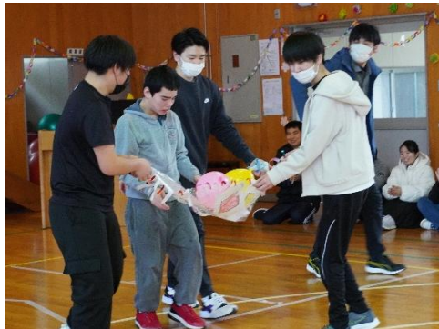
絆を深める 風船運び

祝う会に向けて、在校生・卒業生それぞれが心を込めて準備をしました。在校生の出し物として、3年生と一緒に風船運びレースをしました。会場に温かい声援があふれ、楽しいひとときを過ごすことができました。3年生は印象に残った風景にちなんだ思い出を紹介し、保護者に向けた手紙を読んで感動的に締めくくりました。記念撮影での表情は、一人一人やり切った充実した気持ちが表れていました。