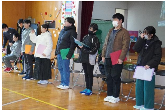
3年生 感動的な発表