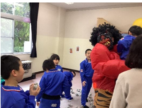
鬼は外にいらっしゃい！