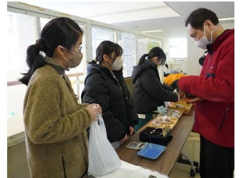
マルシェ(作業製品校内販売)