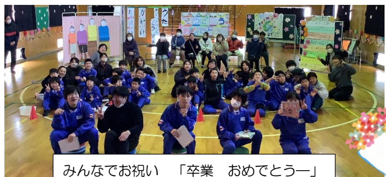
みんなでお祝い 「卒業 おめでとうー」