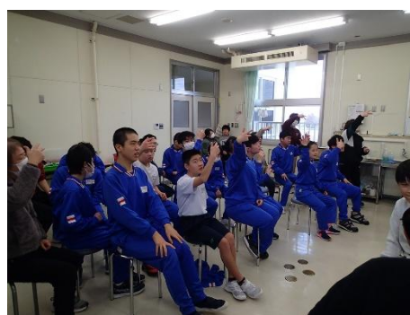
小学部上学年を招待して音楽発表会